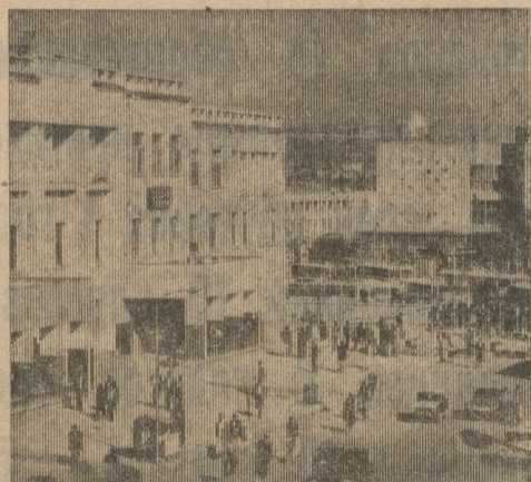
19 АВГУСТА — НАЦИОНАЛЬНЫЙ ПРАЗДНИК ДЕМОКРАТИЧЕСКОЙ РЕСПУБЛИКИ АФГАНИСТАН — ДЕНЬ ВОССТАНОВЛЕНИЯ НЕЗАВИСИМОСТИ [1919]

Против нарушителей трудовой дисциплины и пьянства в автопредприятии непримиримую борьбу ведут все общественные организации во главе с партбюро.