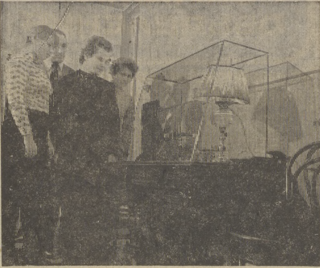
На снимке: экскурсанты в комнате-музее В. И. Ленина в Смольном.