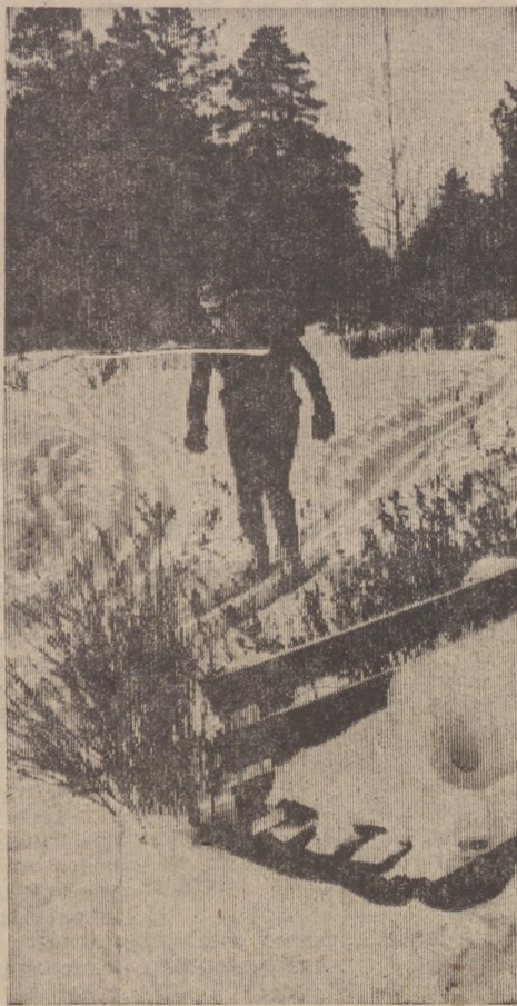
Никогда не пустует лыжня в городском парке культуры и отдыха.