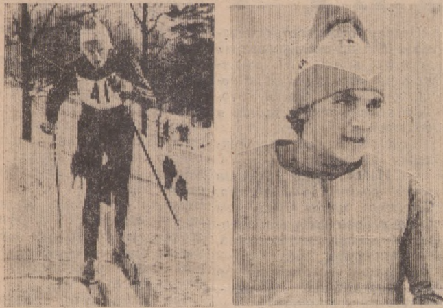
Чемпионами Белой Олимпиады стали советские лыжники Николай Зимятов из Московской области и Раиса Сметанина из Сыктывкара (на верхних снимках), бобслеист ленинградец Анатолий Алябьев и конькобежка москвичка Наталья Петрусева (на снимках внизу).