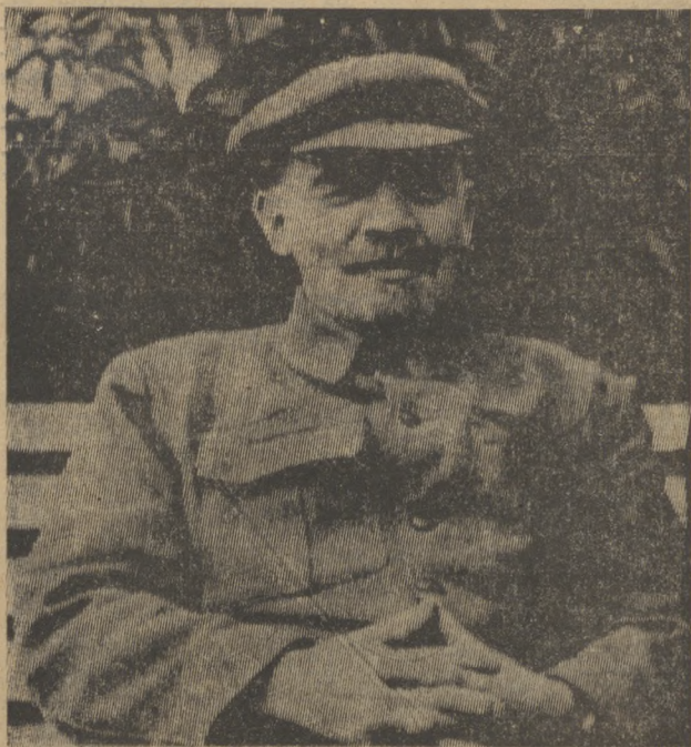
В. И. Ленин. [Фрагмент фотографии «В. И. Ленин и М. И. Ульянова в Горках», 1922 г., начало августа. Горки.]