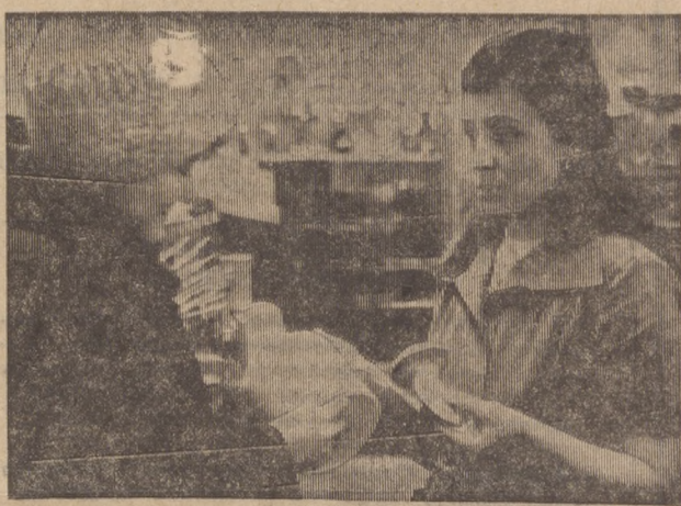
К Дню Советской Армии и 8 Марта коллектив магазина № 51 по улице Западной организовал продажу подарочных наборов. 420 подарков на две тысячи рублей продано за неделю.

Этот вопрос волнует еще некоторых первоуральцев. Сообщаем, что по этому поводу им нужно обратиться в военкомат, в комнату № 7.