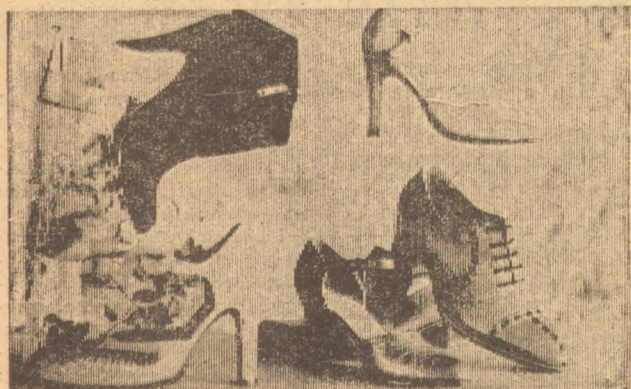
На снимке: образцы новой обуви производственного объединения «Масис» (Ереван).