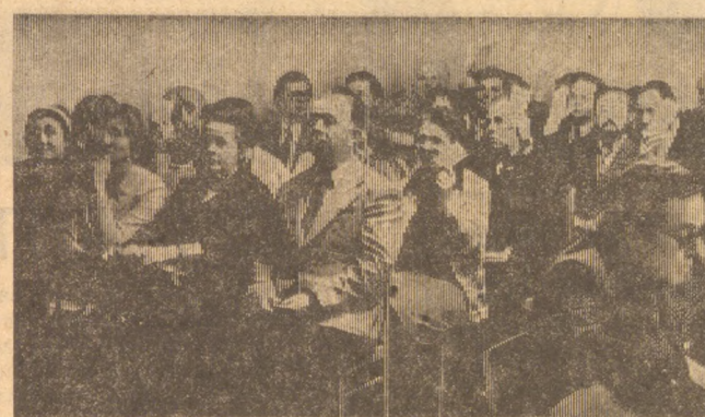
* Городская отчетно-выборная конференция общества «Знание»

Переломным моментом в развитии предприятия стал 1928 год, когда завод посетил выдающийся деятель Коммунистической партии и Советского государства В. В. Куйбышев и поддержал идею значительного расширения предприятия. Уже в годы первой пятилетки строится завод № 2 (ныне цех № 2) и другие производственные объекты. Всего три года потребовалось, чтобы построить и пускить по тем масштабам такой завод-гигант. Тогда же был построен клуб им. Ленина. Как известно размах и крупные задачи первых пятилеток вызвали невиданный энтузиазм, который ломал привычные трудовые