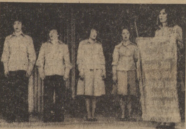
На кустовом смотре художественной самодеятельности училища профтехобразования успешно выступила агитбригада ГПТУ № 7.