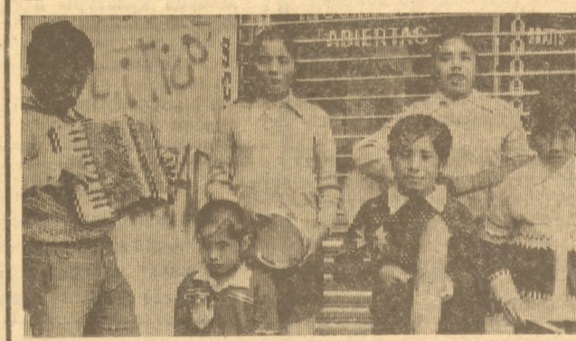
Мексика. По данным профсоюзных, в стране насчитывается около 7 миллионов безработных, практически каждый третий взрослый мексиканец. Постоянно растет стоимость жизни, бьющая прежде всего по карману трудящихся. На снимке: эта семья уличными концертами зарабатывает себе на жизнь.