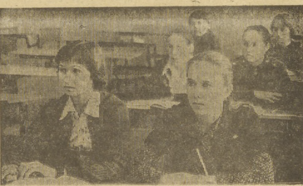
Эти ребята решили стать штукатурами-малярами. Они осваивают азы профессии в седьмом профессионально-техническом училище. Теоретические знания им дают опытные преподаватели, а мастера производственного обучения — практические навыки. Занятия проходят в хорошо оборудованных кабинетах, лабораториях, мастерских. На снимке: учащиеся группы 12 — 13 на уроке истории.

На теплоотрасе надлежит уложить 150—200 метров труб диаметром 400 мм. Работы идут черепашьими темпами. Изоляционный материал не подвезен. Управление выделяет очень мало рабочих, например, 23 октября здесь трудилось всего два сварщика.