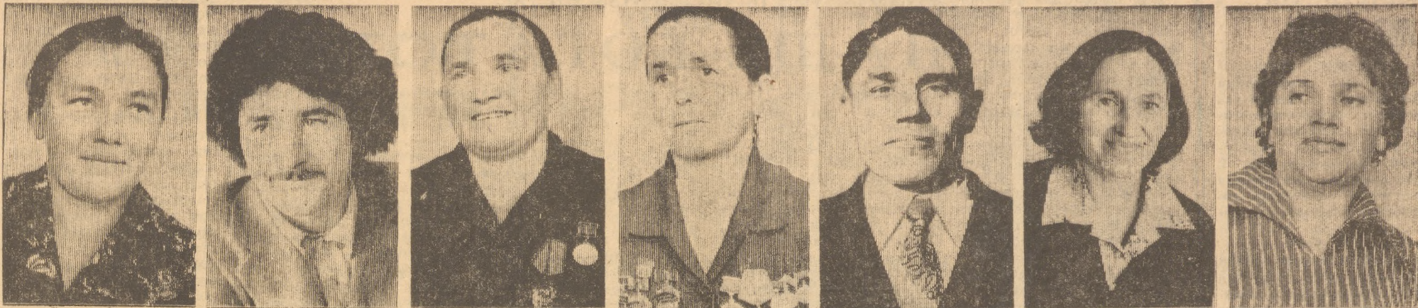
ПРОЛЕТАРИИ ВСЕХ СТРАН, СОЕДИНЯЙТЕСЬ!