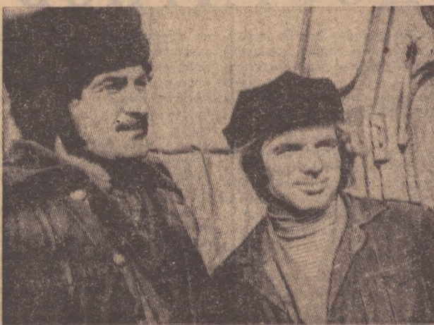
■ НАВСТРЕЧУ ВЕСЕННЕМУ СЕВУ