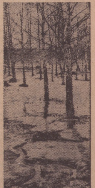
Последний снег.

В этих публикациях поднимаются актуальные вопросы по защите окружающей среды, — говорит пред-