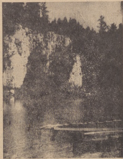
Чусовая. Плавно несет она свои воды в окрестностях города. Удивительной красоты берега привлекают путешественников из многих уголков страны. А уж первоуральцы здесь — завсегдатаи. Им знакомы скалистые уступы, нависшие над рекой, богатая уральская флора и фауна, которая постепенно набирает былое обилие благодаря заботе человека.

Г. ЖЕЛТОБРЮХОВА, заведующая культурно-массовым отделом.