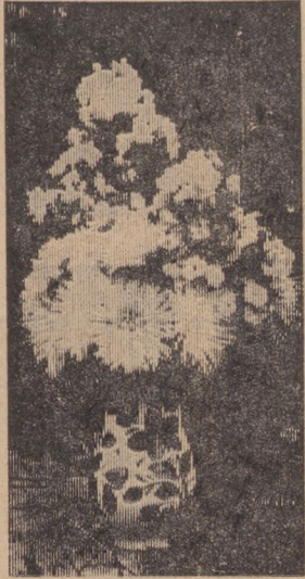
На снимках: «Нежность»; у экспонатов.

итоги выставки. Будут названы победители, но не в этом цель организаторов. Их больше радуют слова, которые оставили в книге отзывов посетители: «Богата наша природа, но мы убедились в том, что фантазия и умению ребят тоже нет предела», «Пусть все дети будут добры к природе, и тогда жизнь их будет очень красивой и интересной». За этими строчками стоят лишь несколько подписей, но, думается, что к ним охотно присоединится более 1200 человек, побывавшие в дни выставки в читальном павильоне парка.