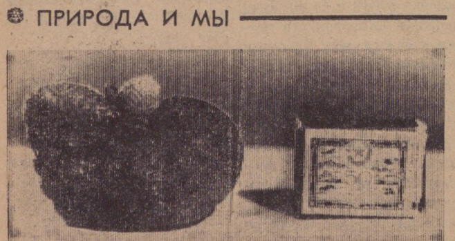
Терпение и трудолюбие — лучшие помощники садовода. Они помогут и при неблагоприятной погоде добиться от природы щедрого урожая. Вот какие ягоды вырастила садовод коллективного сада № 42 Т. В. Злоказова.