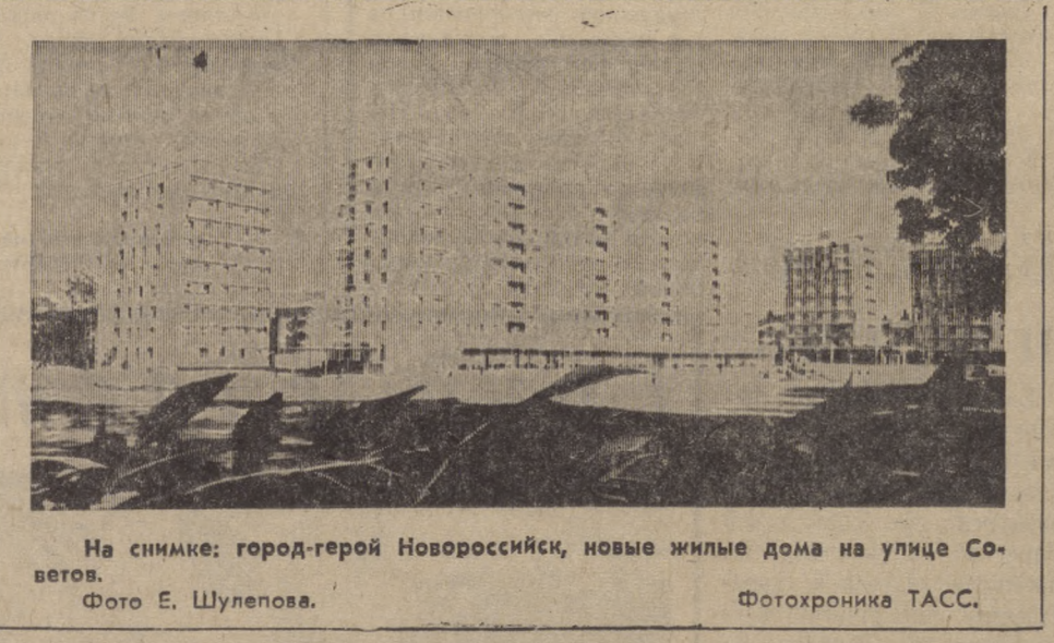
На снимке: город-герой Новороссийск, новые жилые дома на улице Советов.

И все-таки главное, почему я рассказываю об этих людях, даже не знакомых друг с другом: нынче они снимаются с воинского учета. Мужчины рождения 28-го, люди, которые пронесли свою воинскую обязанность только через мирные годы. Конечно, они в любой момент были готовы защитить Родину. Но в том, что этого момента не было, есть и их заслуга. Потому что они настоящие солдаты, идеально знают военную технику, умеют ею управлять. И еще потому, что они замечательные рабочие, такие, которые каждодневным трудом крепят могущество Отчизны.