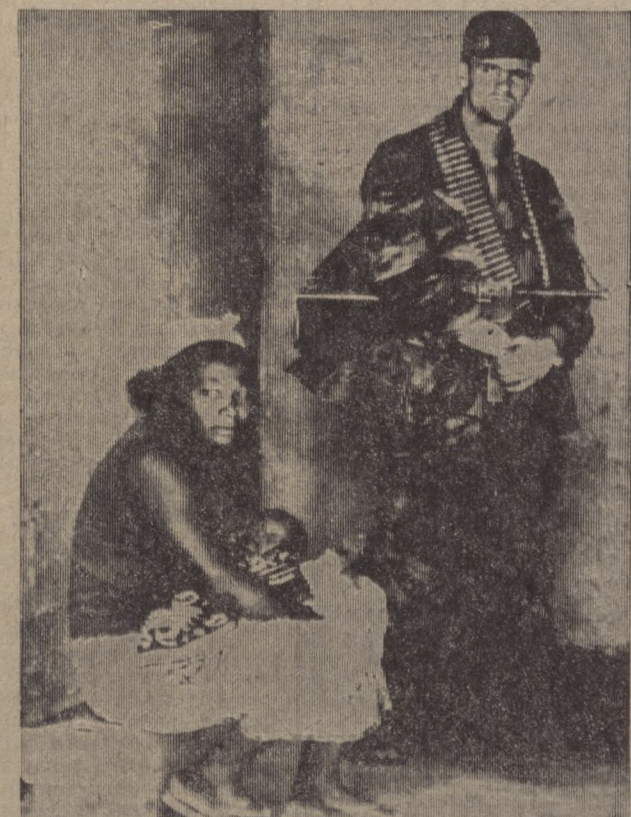
На снимке: французский каратель в доме африканца в пригороде Колвези.