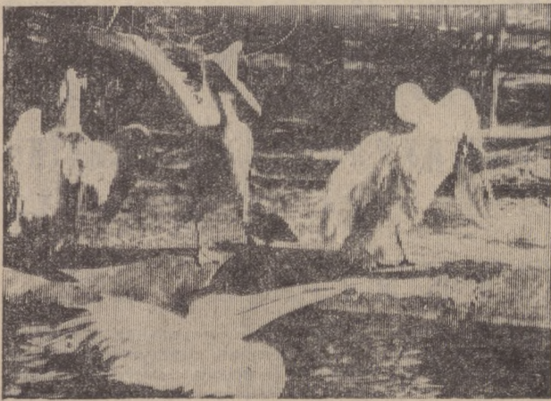
Белый танец пеликанов.