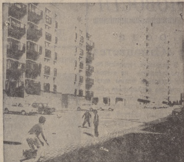
ВНР. Десятки тысяч семей справили в текущем году новоселье в построенных для них комфортабельных квартирах.

И еще. В городе много любителей собак. Казалось бы, в этом увле-