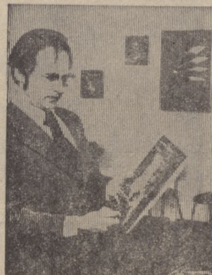
ГДР. Выставка — продажа советских грампластинок проведена в дрезденском Доме книги. Любителям музыки здесь были предложены 12.000 дисков с записью различных музыкальных произведений.