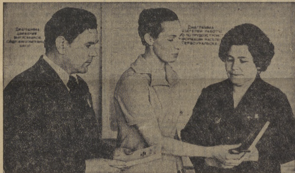
В ПОМОЩЬ АГИТАТОРАМ, ПОЛИТИНФОРМАТОРАМ