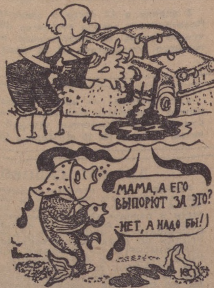
Рисунки Ю. Коршева.