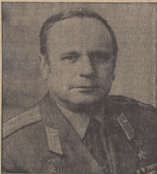
Командир космического корабля «Союз-24», летчик-космонавт СССР, Герой Советского Союза, полковник Виктор Васильевич Горбатко.