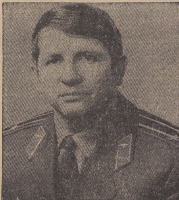
Бортинженер космического корабля «Союз-24», подполковник инженер Юрий Николаевич Глазков.