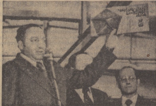
■ Первоуральской продукции ЗНАК КАЧЕСТВА

Кровный долг, дело чести руководителей предприятий промышленности, строительства, транспорта, всех тружеников города — улучшить шефскую помощь городским совхозам. От этого будет во многом зависеть улучшение снабжения города продуктами сельского хозяйства.