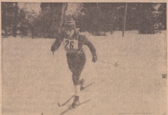
Редактор С. И. ЛЕКАНОВ.

Эти снимки рассказывают о зональных соревнованиях по лыжам среди юниоров Центрального совета ДСО «Труд».