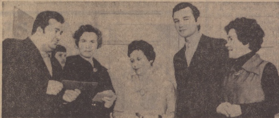
■ УДОБРЕНИЯ — НА ПОЛЯ