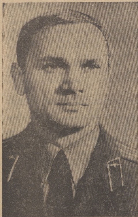
КОМАНДИР КОСМИЧЕСКОГО КОРАБЛЯ «СОЮЗ-27» ПОДПОЛКОВНИК ВЛАДИМИР АЛЕКСАНДРОВИЧ ДЖАНИБЕКОВ.