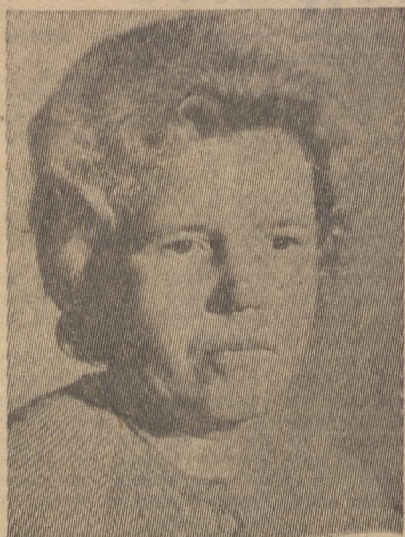
■ МАСТЕР — ОРГАНИЗАТОР И ВОСПИТАТЕЛЬ

И последнее. На оперативном совещании в торге руководителям магазинов еще раз напомнили о беспорядочном приеме бутылок емкостью 0,75 литра».