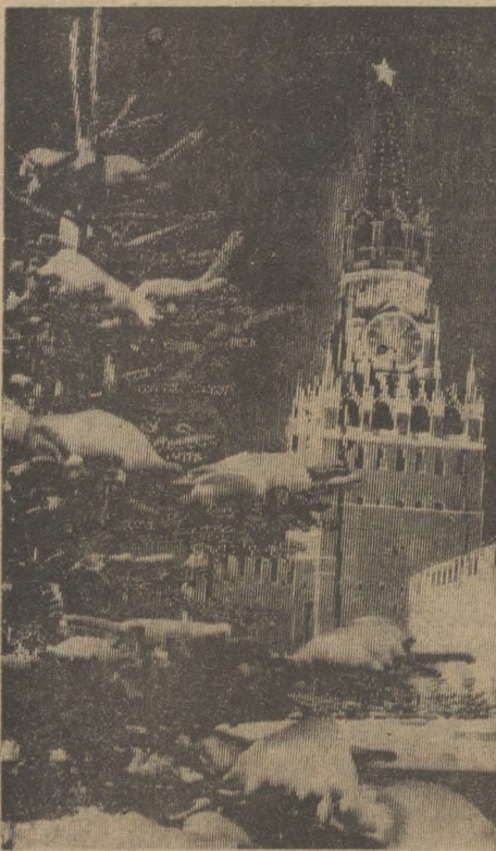
МОСКВА. Спасская башня Кремля.