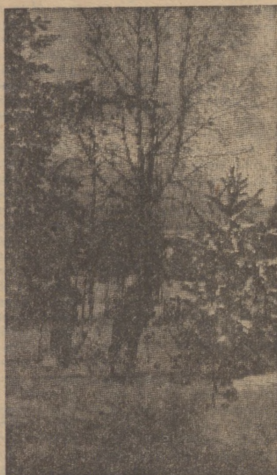
Хорошо дышится в зимнем лесу!