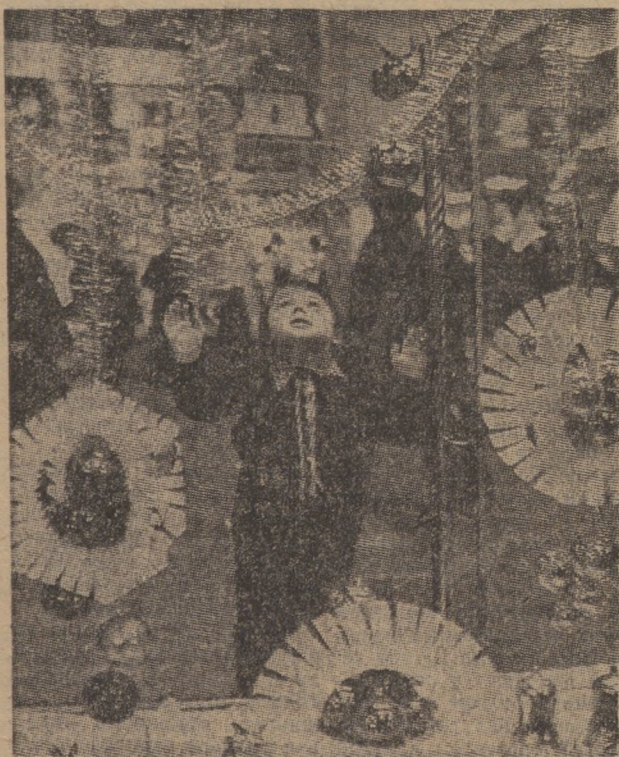
Скоро Новый год.

начальник городской станции технического обслуживания.