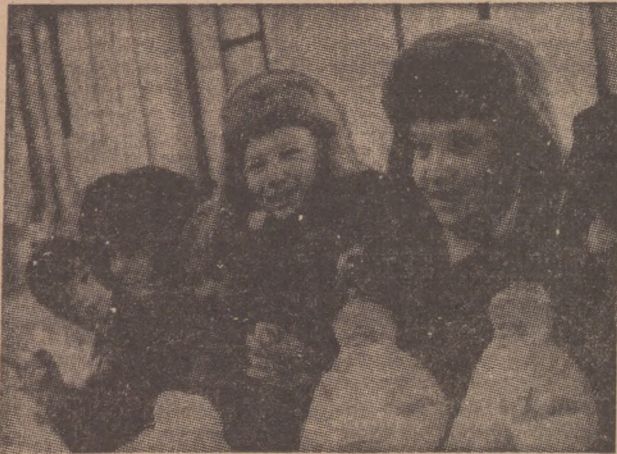
В магазине «Малыш» — веселый елочный базар. В торговом зале оживленно. Особенно много здесь ребятишек.