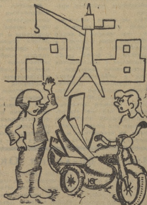
— Зачем платить? Отец, слышишь, рубит, а я отвожу...