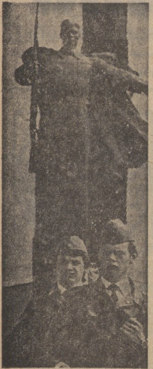
ПЕНЗА. Октябрьский район — самый крупный в Пензе. Здесь размещено около 50 промышленных предприятий, строительных, транспортных и торговых организаций.

На снимке: у монумента павшим воинам на площади Победы учрежден пионерско-комсомольский пост № 1.