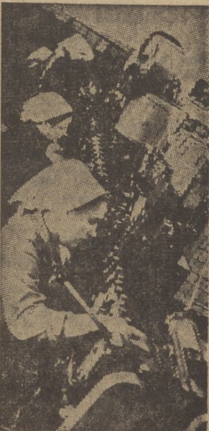
Автоматика надежно служит рабочим пивоваренного завода. На снимке: автоматическая линия разлива пива.

НЕЗГОВОРОВА, КОЗЛОВ, КОУРОВА, КУДРЯВЦЕВ, КОСОВА — жители поселка птицефабрики.