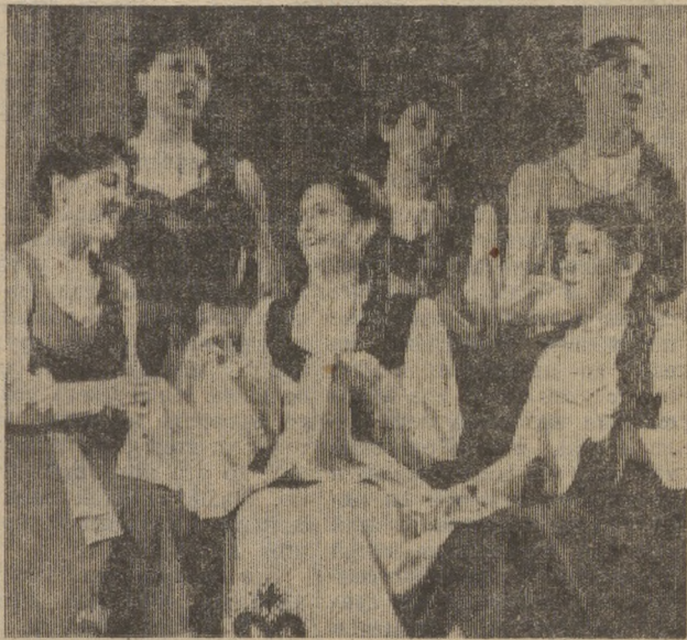
РАБОЧИЙ КОЛЛЕКТИВ — ОДНА СЕМЬЯ На снимке: выступает народный коллектив, лауреат первого Всесоюзного фестиваля самодеятельного художественного творчества трудящихся, хор русской песни Челябинского трубопрокатного завода.