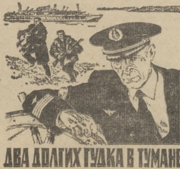
ДВА ДОЛГИХ ГУДКА В ТУМАНЕ

КИНОТЕАТР «ВОСХОД» ДЕМОНСТРИРУЕТ НОВЫЙ ЦВЕТНОЙ ШИРОКОЭКРАННЫЙ И ОСТРОСЮЖЕТНЫЙ И ДЕТЕКТИВ КИНОСТУДИИ «ЛЕНФИЛЬМ».