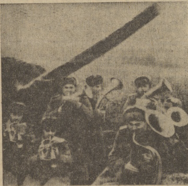
На снимке: выступление военных музыкантов на парадной. 1943 год.