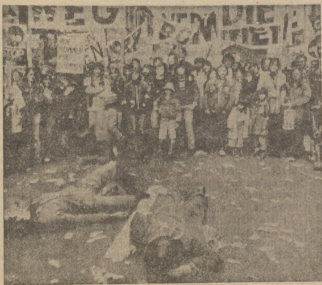
БЕЛЬГИЯ. Крупнейшая общенациональная демонстрация за мир и разоружение состоялась в Брюсселе.

А. АЛИКИН, редактор Ачитской районной газеты «Путь Октября».