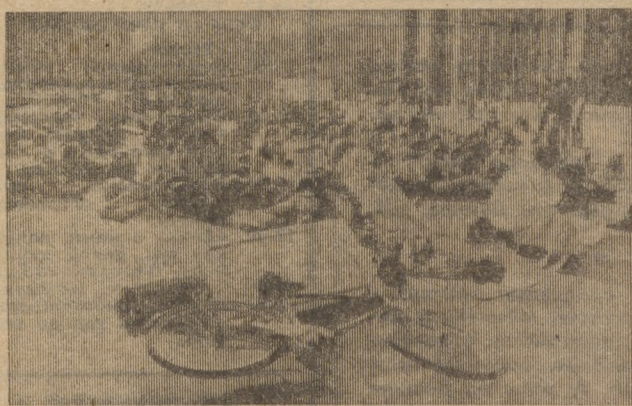
«Прекратить безумие!», «Остановить производство нейтронной бомбы!», «Нет — нейтрону оружию!» — под такими лозунгами состоялись демонстрации сторонников мира ФРГ во Франкфурте-на-Майне, Дюссельдорфе, Штутгарте и ряде других городов страны. На снимке: участники сидячей демонстрации в Штутгарте. Некоторые манифестанты лежат на асфальте, изображая жертвы нейтронного оружия.

В. ЛОГУНОВ, заместитель управляющего трестом Уралтяжтрубстрой по экономическим вопросам.