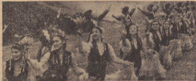
Высоким исполнительским мастерством славится Государственный ансамбль танца Киргизии. Изучение быта людей труда, старинных и новых обычаев и обрядов помогло артистам возродить национальные танцы во всей их самобытности, вдохнуть в них истинную народность.

В репертуаре ансамбля также танцы народов СССР и зарубежных стран.