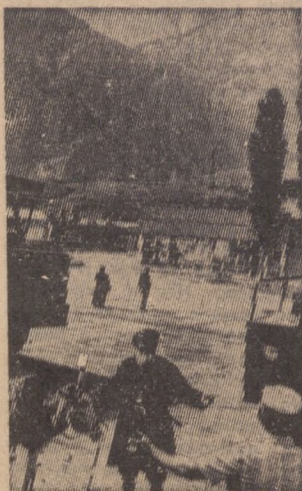
Токтогульская ГЭС. В гости к внуку, строителю ГЭС.