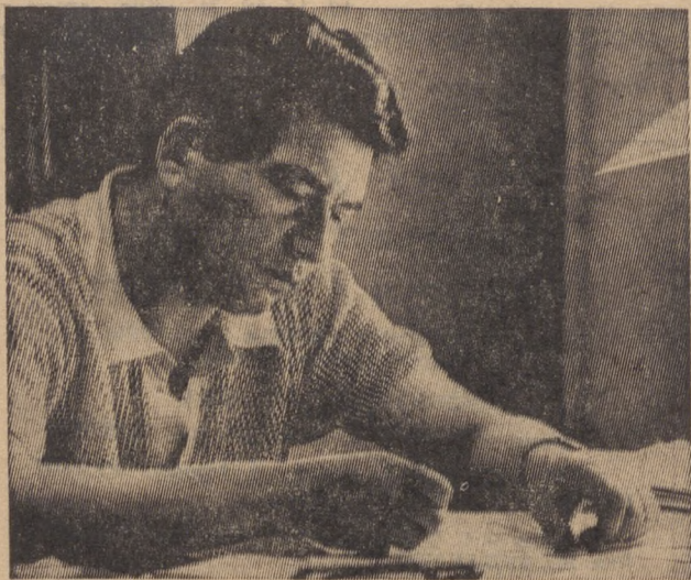
Писатель Чингиз Айтматов за работой.