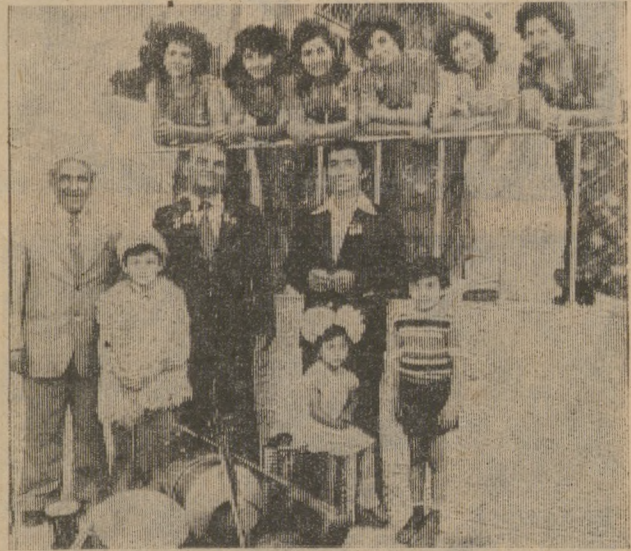
НА СЦЕНУ — ВСЕЙ СЕМЬЕЙ

АЗЕРБАЙДЖАНСКАЯ ССР. Живой интерес у публики всегда вызывают выступления семейного ансамбля «Хатир» («Воспоминание»).