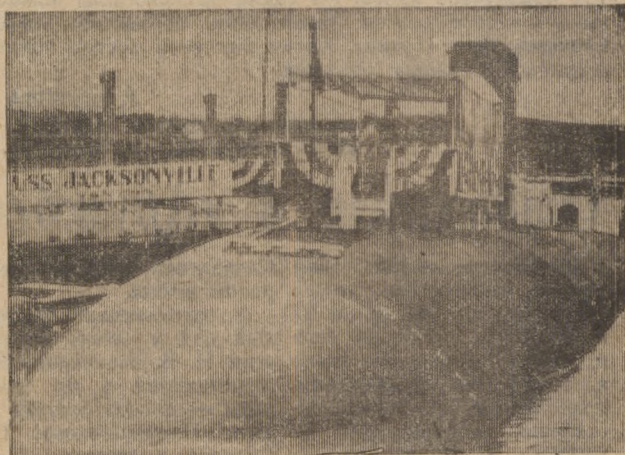
США. На вооружение военно-морских сил Соединенных Штатов поступила еще одна ударная атомная подводная лодка «Джексонвилл» (на снимке), построенная на судостроении в Гроуте (штат Коннектикут).