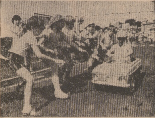
В Брянском парке «Соловьи» для маленьких горожан открылся автогородок. Как на улицах настоящего города, здесь есть светофоры и переходы, проезды и тупики, дорожные знаки и мосты. Оборудован класс для изучения правил дорожного движения. Руководит обучением ребятишек в автогородке работники ГАИ. На снимке: соревнование юных автомобилистов на улицах автогородка.