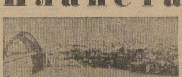
Сидней — крупный экономический и торговый центр Австралии. Население — более 3 миллионов человек. Основанный в 1788 году, город стал первым поселением европейцев на дальнем Австралийском континенте.