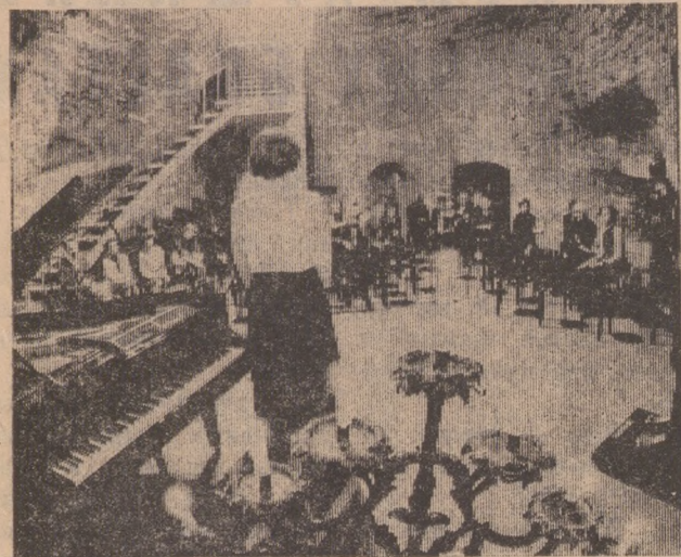
На шести ярусах башни XV века Кик-ин-де-Кек (в переводе значит «Загляни в кухню»), самой мощной в оборонительном поясе городской стены Таллина, после тщательных реставрационных работ в 1968 году открыт филиал Таллинского городского музея. Здесь часто устраиваются выставки и концерты. Вот и сейчас на снимке запечатлен момент музыкального вечера в одном из залов Кик-ин-де-Кек.