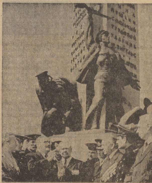
Встреча ветеранов Краснознаменной ордена Ушакова I-й степени Днепровской военной флотилии с курсантами Киевского высшего военно-морского политического училища.