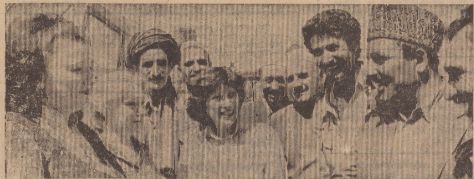
Смешанное афганско-советское транспортно-экспедиторское общество «АФСОТР» ведет значительную работу по обеспечению перевозок транзитных грузов на территории Демократической Республики Афганистан.