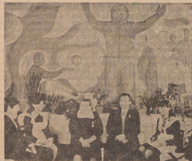
К 20-летию полета Ю. А. Гагарина