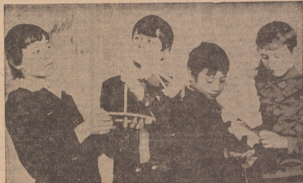
«Мы рождены, чтоб сказку сделать былью...»