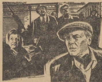
ОСОБО ВАЖНОЕ ЗАДАНИЕ

24 марта. Малый зал Дворца культуры и техники Новотрубного завода. Лекторий «Утверждать человека в себе и других». Лекция о самообразовании. Кинофильм «Горькие уроки». Начало в 18 час. 30 мин.